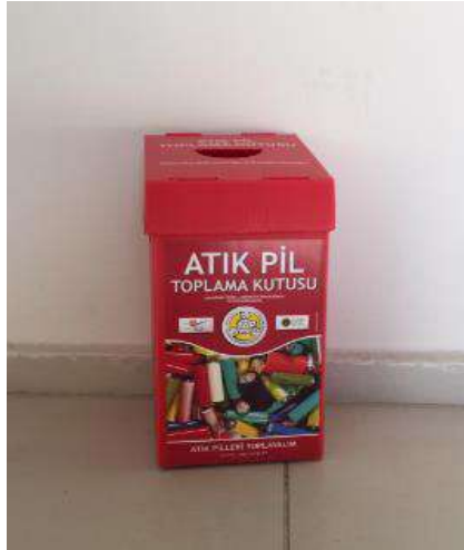
Personel Alanı Pil Geri Dönüşüm